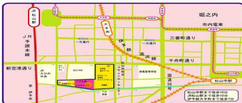
松山市総合コミュニティセンター周辺詳細地図

* タクシーで松山市内中心部より約1,000円/10分。道後温泉地区より約1,500円/15分。